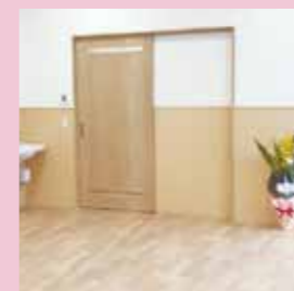
写真上：復活したカフェ室内 写真左：カフェカウンター 写真右：多目的室。貸部屋にも。