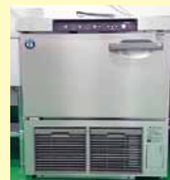
左：スチームコンベクション 真中上：業務用冷蔵庫 真中下：電解水生成装置 右 上：消毒保管庫、食器洗浄機 右 下：ラピッドチラー

2月には待ちに待ったバレンタインです。毎年おれんじ村のバレンタインギフトの御注文有難うございます。気になるあの子におれんじ村のバレンタインギフトはいかがでしょうか？きつと喜ばれる事間違いなし。毎年沢山の御注文を承っており、売り切れ必至。ぜひお早めの御注文をお待ちしています。