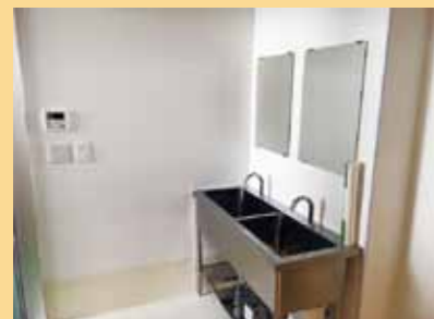
写真上 弁当製造工場。明るく清潔。そして、最新機器がずらり。

私たちは、障害のある人ない人が共に働き、共に生きる職場を創ります。そして、収益性のある事業を通し、労働権の確保や所得保障を進めていきます。