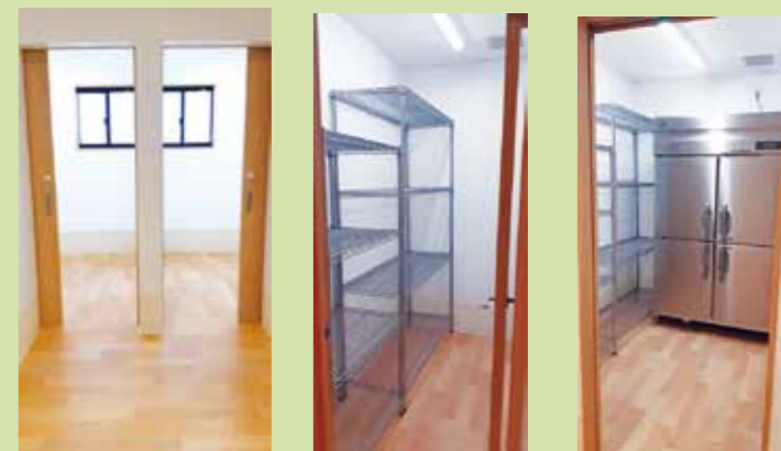
更衣室だけでなく、なんと男女別 包材保管 弁当包材もしっかり収納 食品保管庫 冷凍、冷蔵、常温 食品もしっかり収納

そんな日々に、終止符が。屋内に洗濯機。それ以上に、ガス乾燥機まで完備。まだまだ他にも、男女別の更衣室、包材用の保管庫に食品保管庫、最後に棒雑巾も室内で洗えるように。なんて、素晴らしい。もう最高。嬉しくて、ついつい、にやついてしまいます。