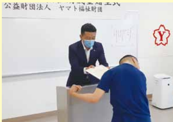
🍊 ヤマト福祉財団様から目録を受け取りました!!

この度は、公益財団法人ヤマト福祉財団様から福祉助成金（ジャンプアップ助成金）を受け、弁当事業拡大に向けての設備整備を行いました。スチームコンベクション、ラピッドチラー、業務用冷蔵庫・冷凍庫、食器洗浄機、器具消毒保管庫、作業台などなど、たくさんのお弁当を製造するための最新の設備が整いました。環境が整ったので、あとは、私たちが力を発揮して、期待に応えるだけです。私たちの一番の強みである営業力を活かし、まずは 300 食の弁当を毎日製造して完売していきます。