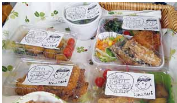
🍊 すべて手書きのメッセージつきです