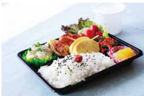
🍊 とても中身にこだわるから、毎日、日替わりのみ!!