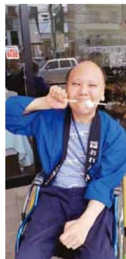
🍊 バナナみたいな綿菓子試食中!!

その日は、わたがしの 無料プレゼントをしました。 実は、かき氷をしようと思 いましたが、その日の午前 中は風が強くて寒かったの で、わたがしプレゼントを しながら、お惣菜を販売しました。