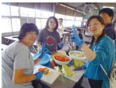
🍌 準備もBBQの楽しみの一つ!!