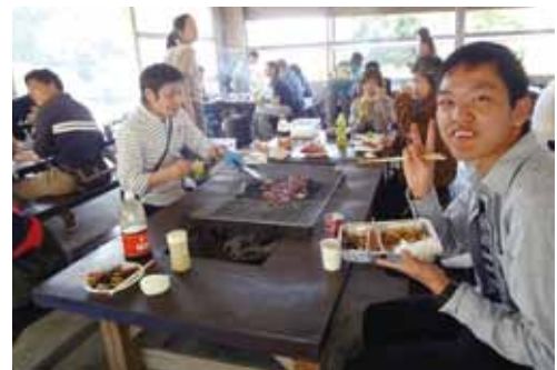
🍌 みんなで食べると美味しいね!!

行く途中につつじが見えて、皆さんは「うわあーきれいね」とか聞こえてきました。桜もいいけどつ