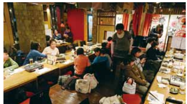
🍊 忘年会の様子です。今年もお疲れ様!!

もつ鍋のしめは…ラーメンを食べました。さらに、デザートも注文し、わらびもちも美味しかったなあ！とっても楽しかった忘年会でした。