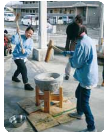
🍊 寒さに負けず、がまだしてます

ついた餅を丸めてぜんざいにしたり、あん餅にしたり、鏡餅にしたりして、みんなで食べました。あー今年ももう少しで終わるんだなあーと思うのと、来年はどんな年になるんだろうと思って食べました。当日は、にじいさん、はあとさんの子どもたちも遊びに来てくれました。