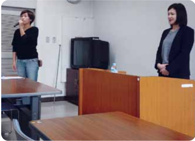
🍊 東警察署の生活安全課から来て頂きました

僕はSNS研修で学んだ事は、ケータイやパソコンにウイルス感染したら恐いのと、メールも悪いメールを開かないようにしなきゃいけないと思いました。