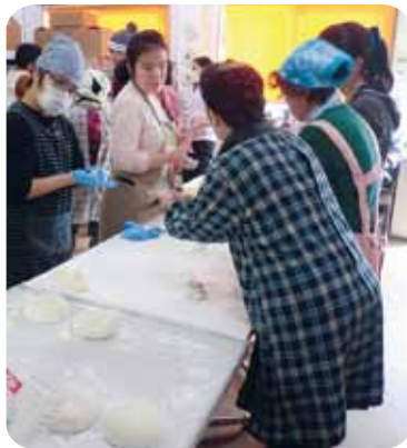
🍊 『かまこひなあーれ』

12月25日(月)におれんじ村恒例のもちつき大会がありみんなで盛り上がりました。地域の方も参加し、「よいしょー」のかけ声がひびきわたり、もちつきならではの風景がありました。事務所の中では、