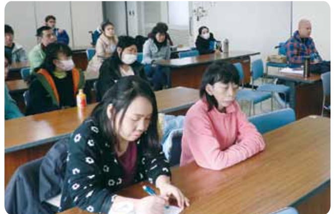
🍊 知らない事いっぱい!! みんな集中してます

僕はSNS研修で学んだ事は、ケータイやパソコンにウイルス感染したら恐いのと、メールも悪いメールを開かないようにしなきゃいけないと思いました。