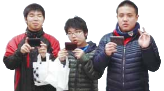
🍊 名刺をもらって記念写真!!