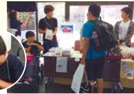
ブックレットにサイン