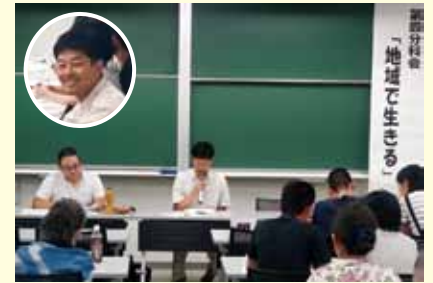
労働センターを代表して、分科会で発表中