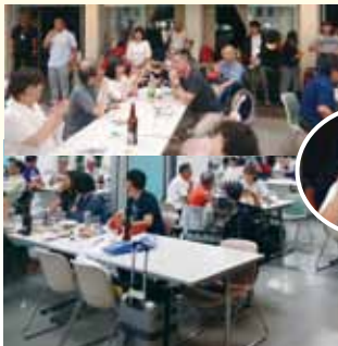
交流会の一コマ。交流会でスピーチしています