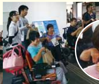
お客様を待ってます