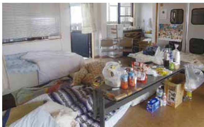
🍌 地震後のおれんじカフェ

また、おれんじ村の花見に参加したい方も大募集です。大勢で、わいわいがやがや、ごちゃまぜの楽しい花見をしましょう。