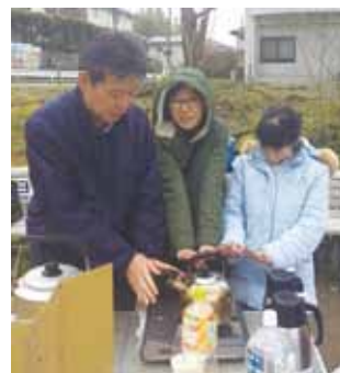
🍌 アルファー米を作るため、お湯を沸かしています