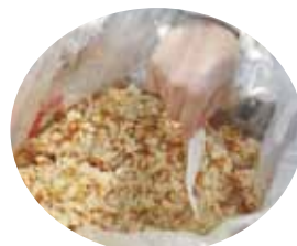
🍌 アルファー米 出来上がり

まずは、昼食の豪華オードブルを食べ、さあこれからみんなで一緒に遊ぼうとゲームを始めようとしたときに、だんだんと雲行きが怪しくなり、雨がポツポツ…とうとう花見は中止になりました。