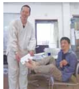
贈呈式。わらわは熊本まで ありがとうね!!