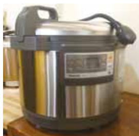
立派な炊飯器です

3升炊きの釜がきましたー!! その大きさに驚きましたが、新しく綺麗でワクワク。そして…お腹が空きます!! これから60人の弁当が作れると思うと営業にも力が入ります。この釜の活躍の場が増えるよう、たくさんの弁当をみんなで力合わせ作って行きます。