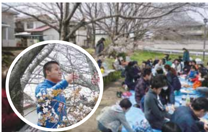
🍌 かんぱーい。みんなご飯に夢中です。

「おれんじ村のお祭りなどで出会った、地域（長嶺）の放課後等デイサービスの子どもたちと一緒に花見をしよう。」という急な思い付きで、おりーぶさん、にじいろさん、はあとさんを無理にお誘いして花見を行いました。