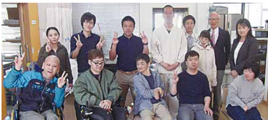
みんなで記念写真