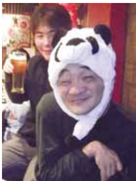
🍊 新人うっしーが豹変!! お酒ってこわーい!!