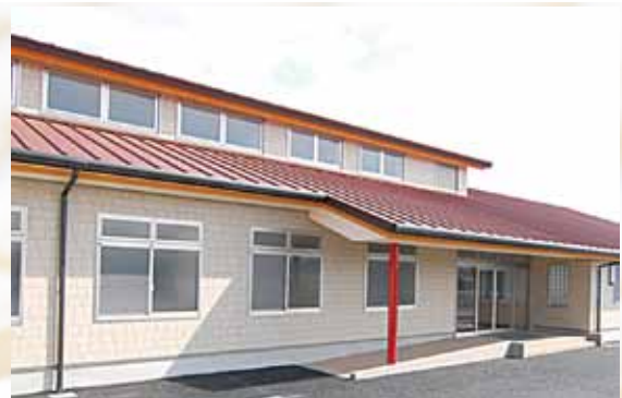
クッキー工場外観

1人1人の生き方や個性を尊重し、生かしていくにはどうしたらよいか、私の課題の一つです。今後研修で学んだ事を、おれんじ村に合った生かし方を考えていきたいです。