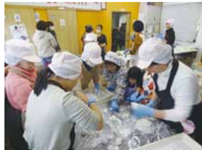
🍊 室内も大にぎわい!! 粉まみれになりながらも鏡餅を作りました!!