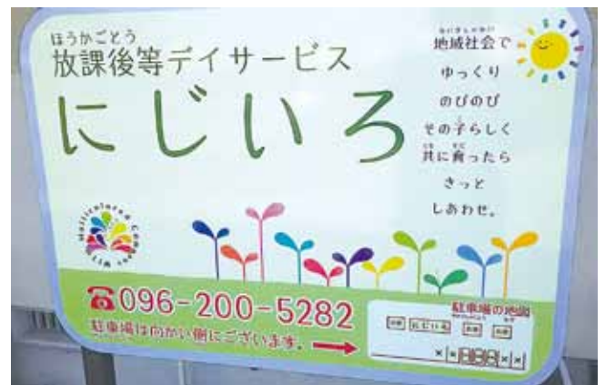
🍊 子供の成長を願う親御さんの思いがこもった看板です