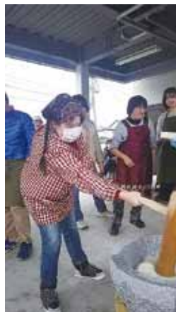
🍊 成人に向けてよいしょー

30kのもち米を延々蒸してくれた仲間ありがとう暑かったね。無事に楽しく終った餅つき大会でした。