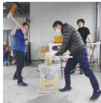
🍊 親子でべったん べったん