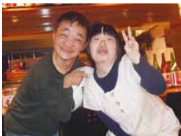
🍊 倉田さんへプレゼント!!