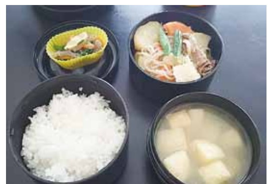
🍊 にじいろ研修中の昼食。 にじいろさんには、おれんじ村の弁当を毎日注文してもらってます。