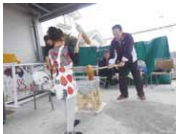
🍊 地域の子供も飛び入り参加!!