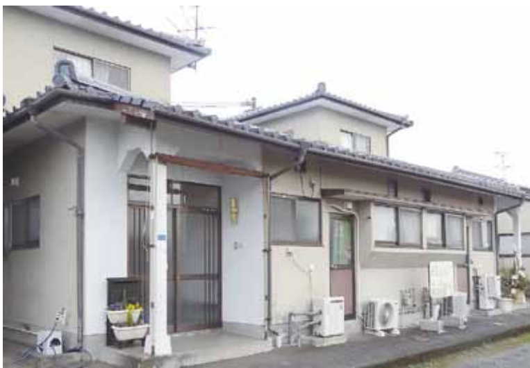
🍊 にじいろさんの建物