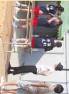
▲皆さんのフットー!! 誰か1番されるでしょうか?

「この場にいるみんなが楽しめるように、3人で精いっぱい祭りを盛り上げよう！」を合言葉に、素敵なステージ発表、店の宣伝、コーラ早飲み募集に声をかけていました。また、今年はインタピビューに多く時間を取り、会場全体が一体となって「参加」できるよう趣向をこらして見たりもしました。みなさん如何でしたでしょうか。例年とは異なり、夏の時期の開催となりましたが、熱さを忘れてしまいうほどに楽しんで頂けたのなら幸いです。それでは、また来年の祭りをお楽しみに。たくさんのご参加、ありがとうございます。