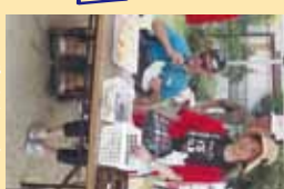
▲ホトをR中～何を言うの～