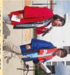
▲皆さんのチアリーダーを賞めています