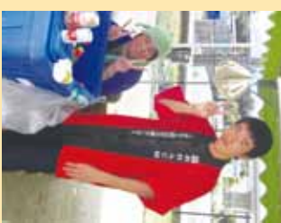
▲暑い中 旗を頑張っています