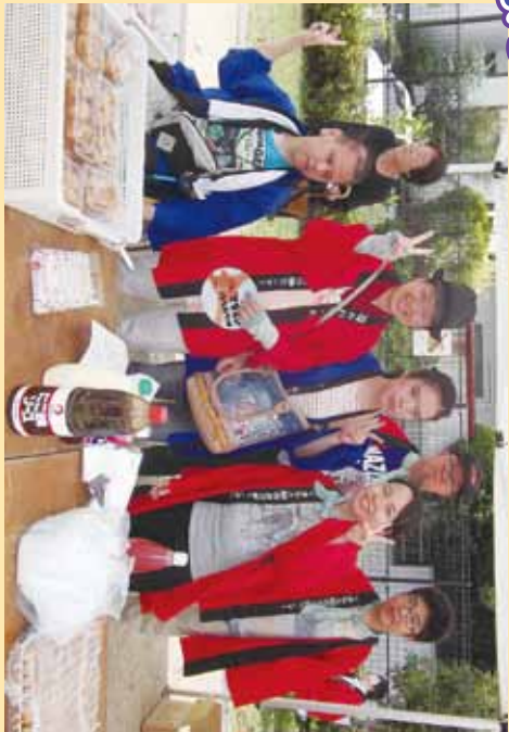
▲揚げたて売りの置さんハイチーズ