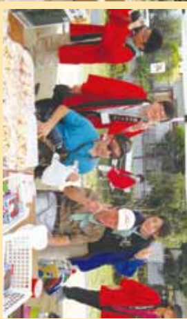
▲いっしょに歌っているよな～