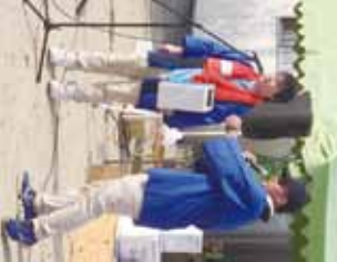
▲たくちゃんにかかっています