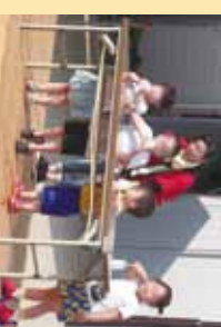
▲チビツチャーン頑張れー