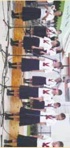
▲西原中の皆さん、素敵な歌声です。