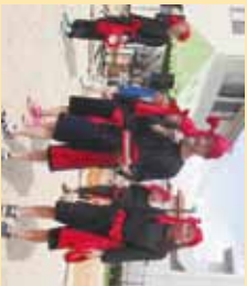
▲サンシャインさんVフォーダンスに向けて