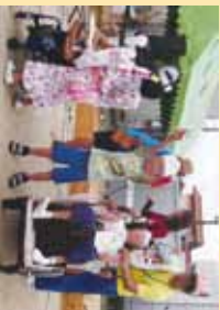
▲アソビマンボーダンスが素晴らしい!!