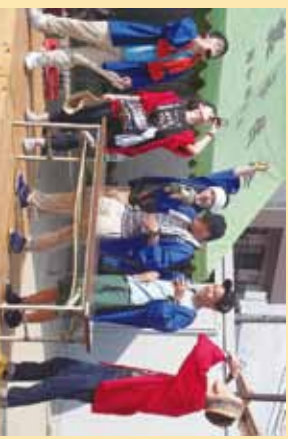
▲おれんじ村民フットー!!