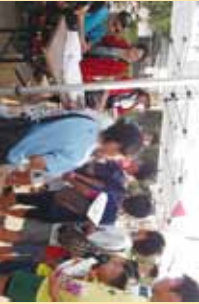
▲グループには長蛇の列!! ホケモノのOには負けないぞ!!