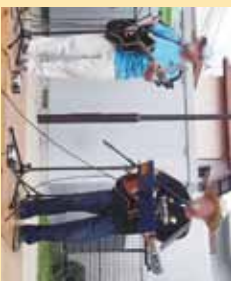
▲昭和の名曲が懐かしいです