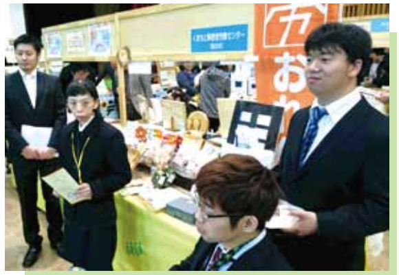
▲センターの皆さんキマッテマス!!

僕は7日に販売の商談会に行って来ました。熊本県内の事業所がいっぱい来ていました。それで僕は緊張しながらも「こんにちはいらっしゃいませ! くまもと障害者労働センターです」と頑張って声を出しました。そしたら、ちょっとずつですが、お客様が来てくれて、自社製品のサーターアンダギーの試食をして買ってくれるお客様がいました。その他にトイレトペーパーや名刺の商談もしていて、トイレトペーパーと名刺が