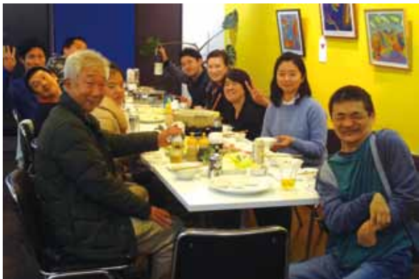
▲これからさあ楽しもう!!

型の組織運営とならざるをえなかったが、どのようにしてみんながかかわる横型の組織運営を取り入れていくのか。」「反対に「横型の組織を維持していくことで、事業の拡大がなかなか進まない現状をどうするのか。」「お互いの長所がお互いの課題であるということです。共に学び合い、知り合うことが、お互いの運営を良くするのではないかと感じました。