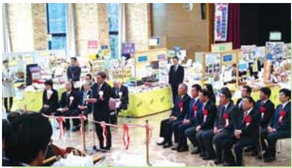
▲県知事さんの挨拶から

僕はこの販売の商談会が2回目でしたので、なんとなくというかちょっとは接客や「いらっしゃいませ」と言う事などが分かったのかなと思いました。あと、スーツだったので、はずかしかったです。